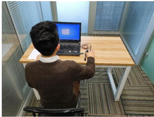
图二：电脑端背面视角