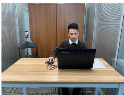
图一：电脑端正面视角

（四）考试开始前，考生需要先登录移动端“智考通”，用前置摄像头 360 度环绕拍摄考试环境，随后将移动设备固定在能够拍摄到考生全身（含侧面）、考试桌面、完整的考试设备（电脑屏幕和键盘等）、考生双手动作（考生行为）及考生周围环境的位置上继续拍摄考试全程（详见说明书中《智考通操作手册》《智考云在线考试规范》）。 请考生注意，视频拍摄角度不得存在盲区，不得无故中断视频录制，考试视频数据不得缺失，不得出现影响考务人员判断本场考试有效性等情况，否则将影响成绩的有效性，由考生自行承担后果。